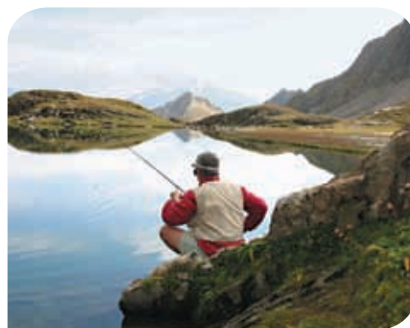
Pêcheur de truite des lacs

Le sentier d'accès longe nombre de ces zones humides, très sensibles au piétinement, véritables conservatoires génétiques, avec une flore (sphaignes, linaigrettes...) et une faune (grenouille rousse, triton alpestre) en équilibre depuis des millénaires.