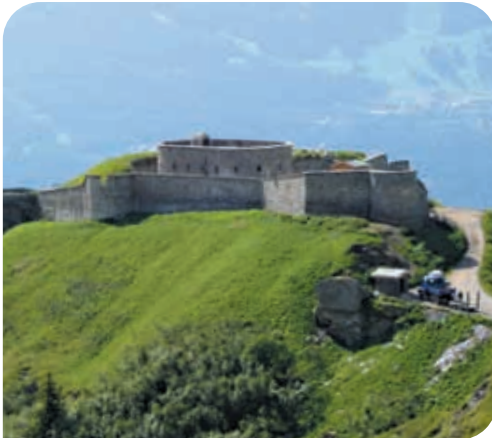
Fort de la Platte vu de dessus

À voir à proximité : Le Fort de la Platte : promenade autour des fortifications et vente de produits locaux tels que la tomme de Savoie, la tomme de chèvre ou le Beaufort.