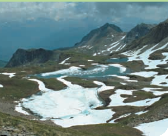
Les trois lacs au printemps