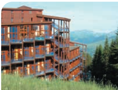
Aiguille Grive aux Arcs 1800