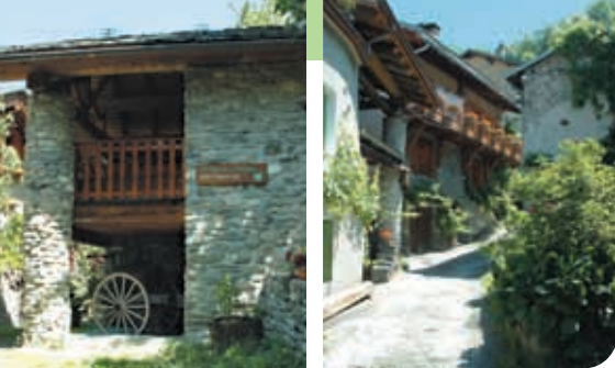
Maison de la Pomme