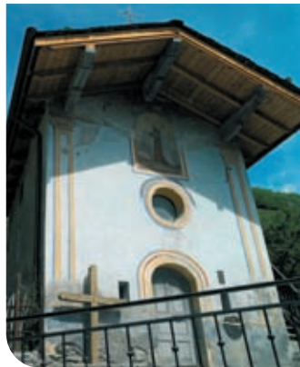
Chapelle Sainte Rose à La Rosière