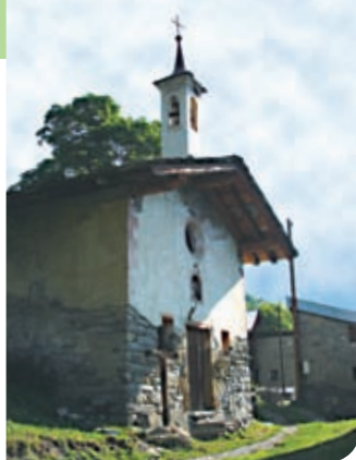
Chapelle de Grandville

grande peste des années 1650. En 1980, comme elle menaçait de s'écrouler, la commune fit enlever la cloche qui trône désormais dans le hall de la mairie. La chapelle fut restaurée en 1987.