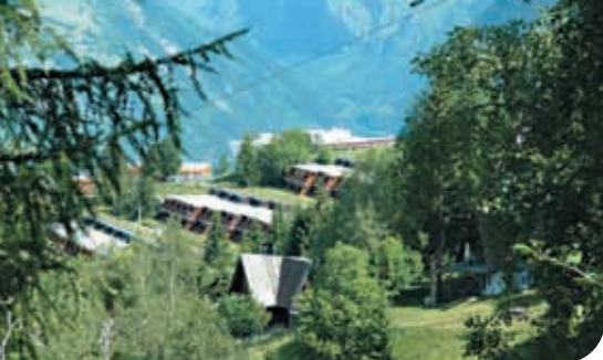
Le Versant Sud aux Arcs 1600, lotissement de chalets pointus